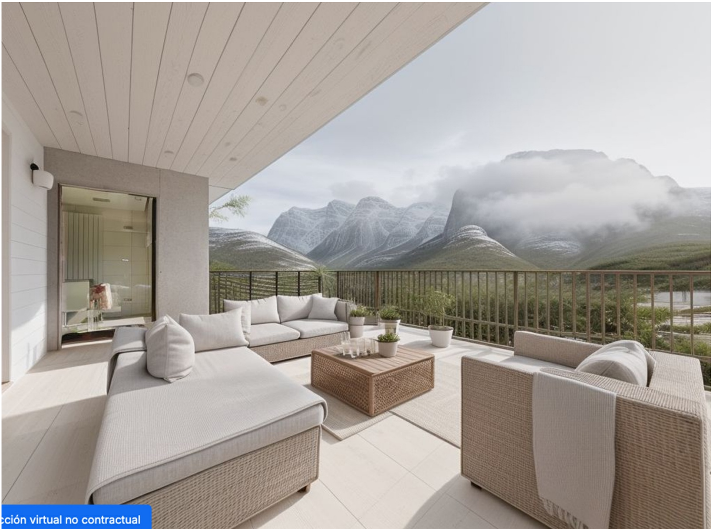
Imagen virtual no contractual